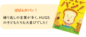
繰り返しの言葉が多く、HUGSの子どもたちも大喜びでした！